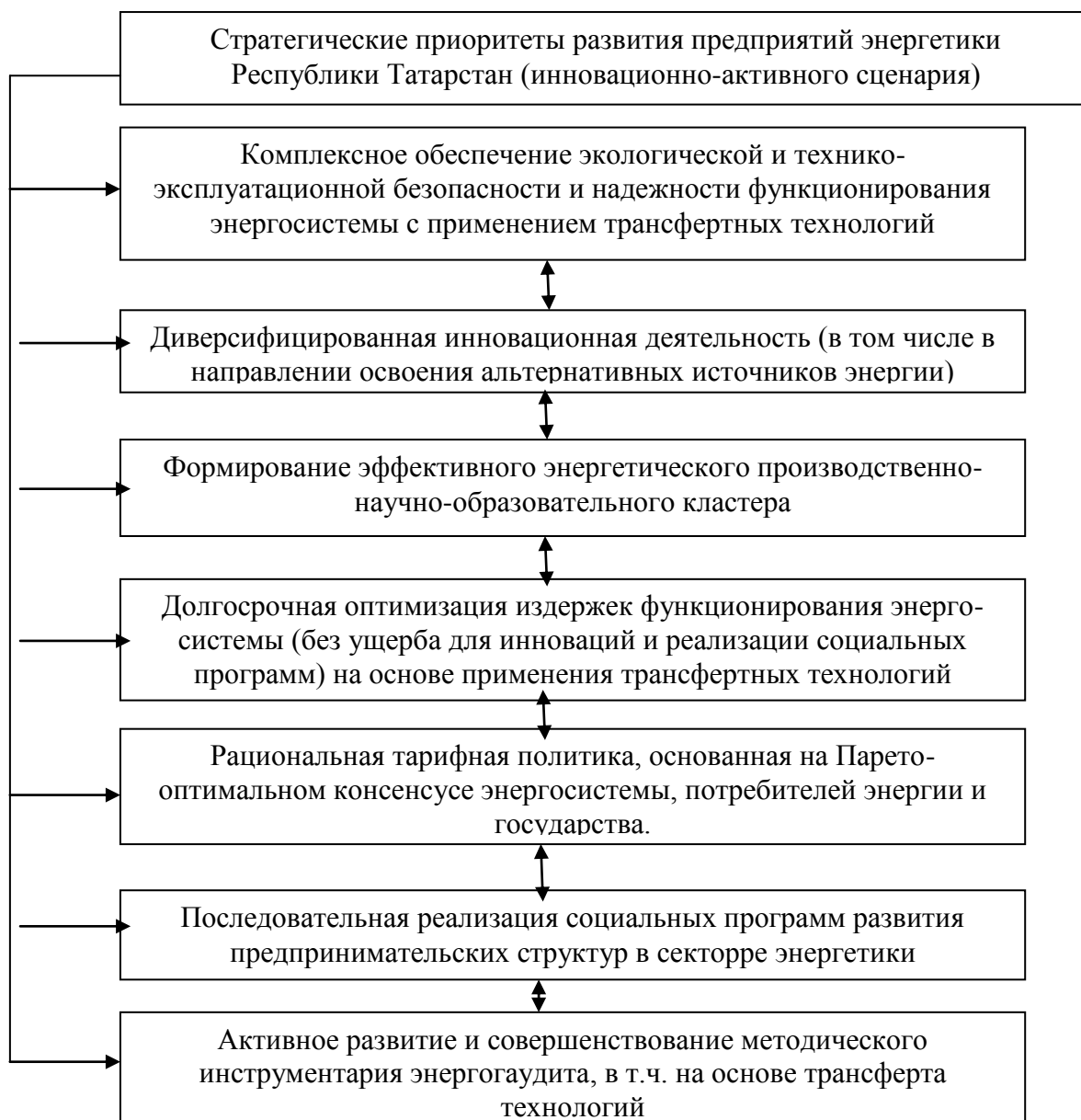
Рис. 3. Предлагаемый комплекс мер по стратегическому развитию энергетических предприятий смешанной формы собственности в рамках реализации инновационно-активного сценария

3) Ежегодное снижение суммарных издержек предпринимательских структур смешанной формы собственности в секторе энергетики на 1,5-2% в реальном исчислении, в первую очередь за счет трансфера и адаптации новых технологий, в том числе организационного и управленческого характера.